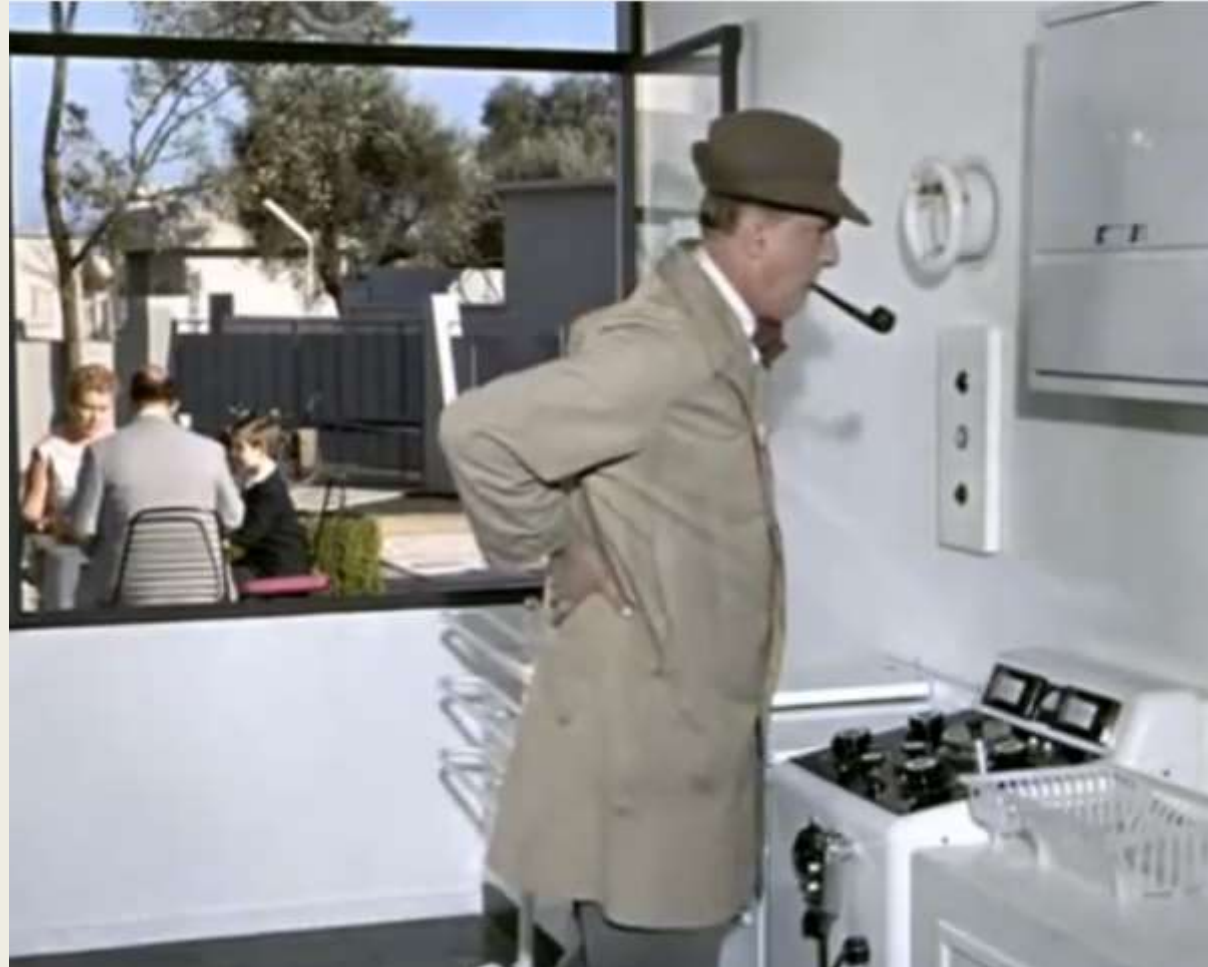
CINÉMA (extrait) Mon Oncle Jacques Tati 1958