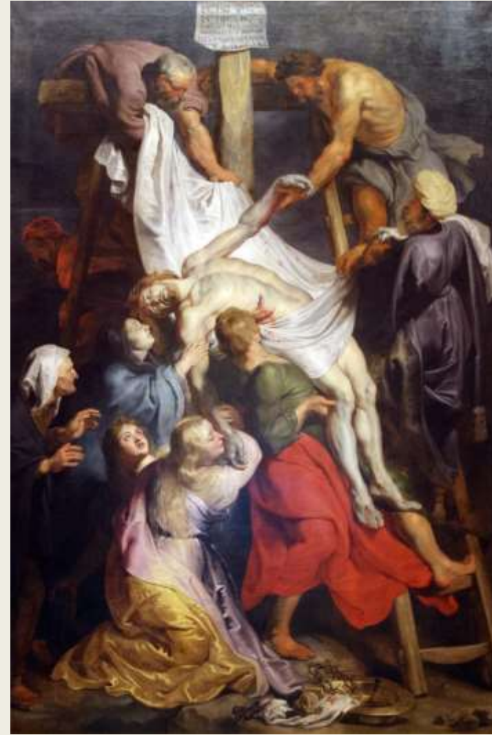
Rubens, La Descente de croix, 1632 Palais des Beaux-Arts, Lille