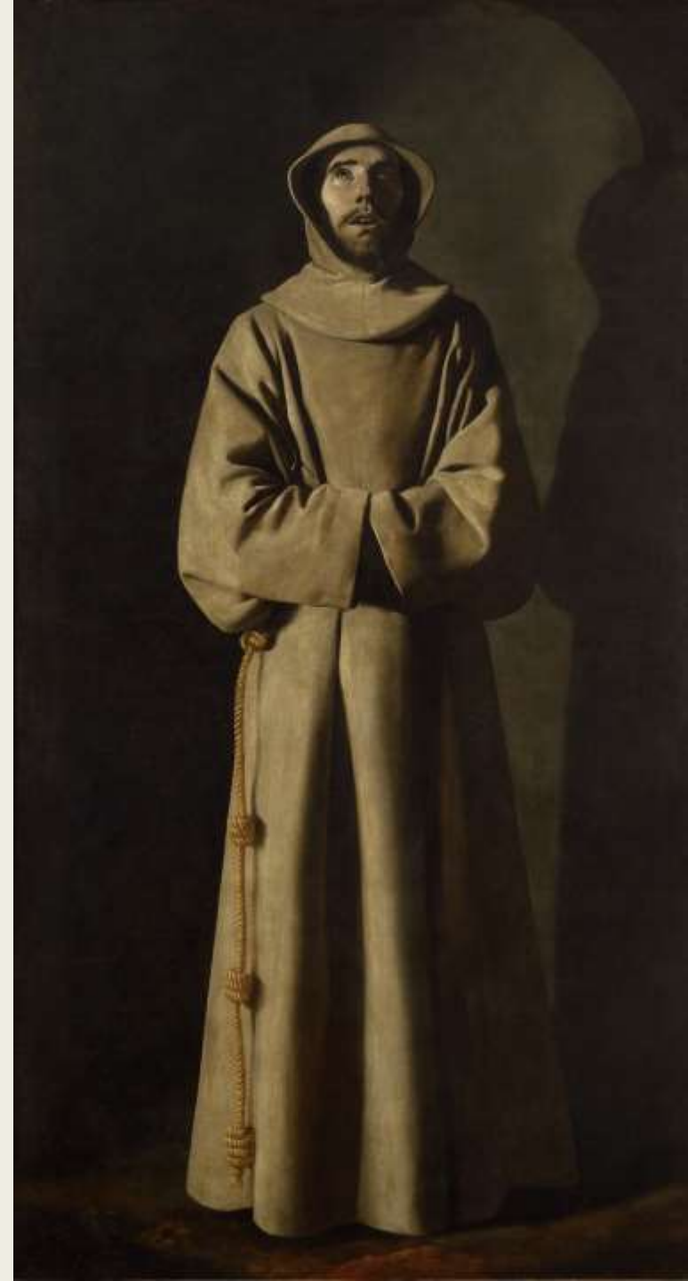
F. de Zurbaran St François d'Assise 1659 Musée des Beaux-Arts, Lyon