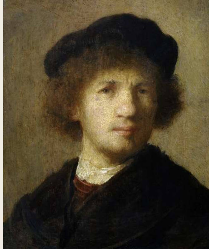
Rembrandt Autoportrait, 1630 Nationalmuseum, Stockholm