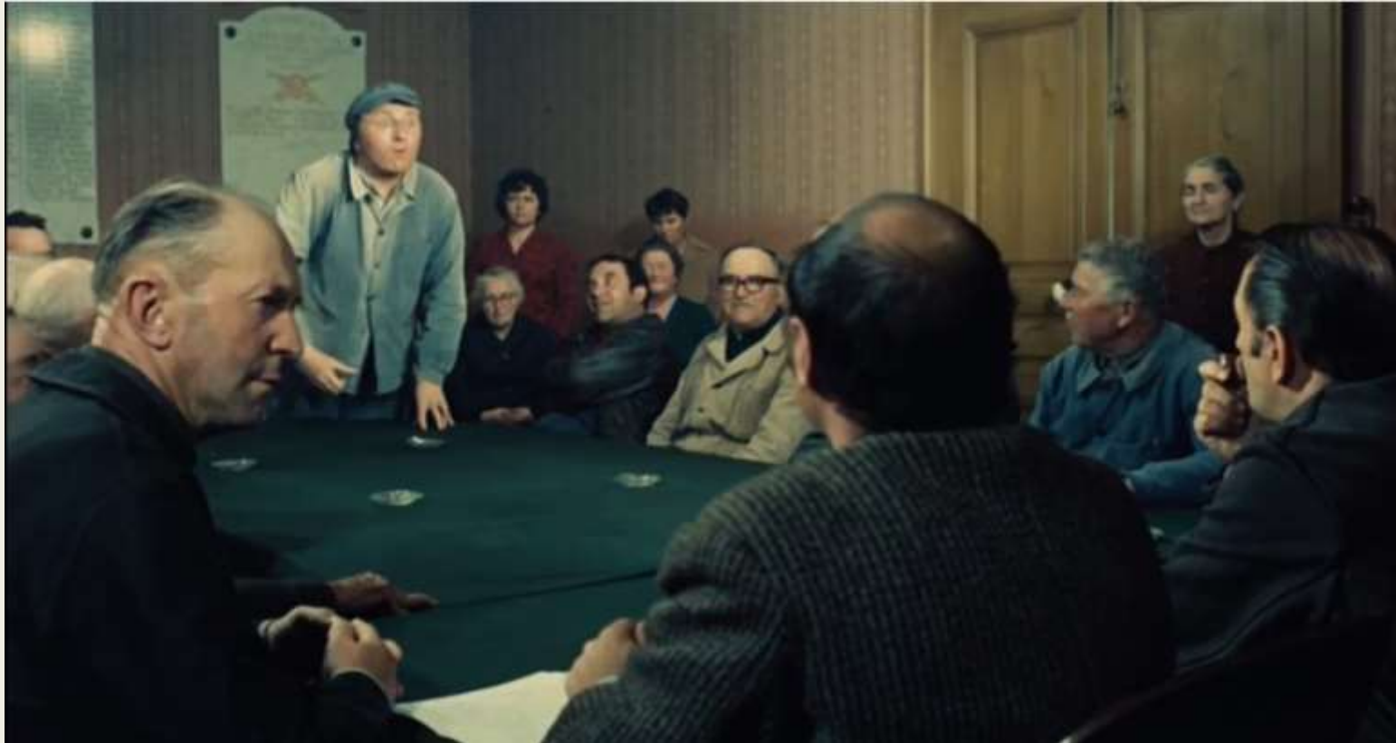
CINÉMA (extrait) Alexandre le bienheureux Yves Robert 1968