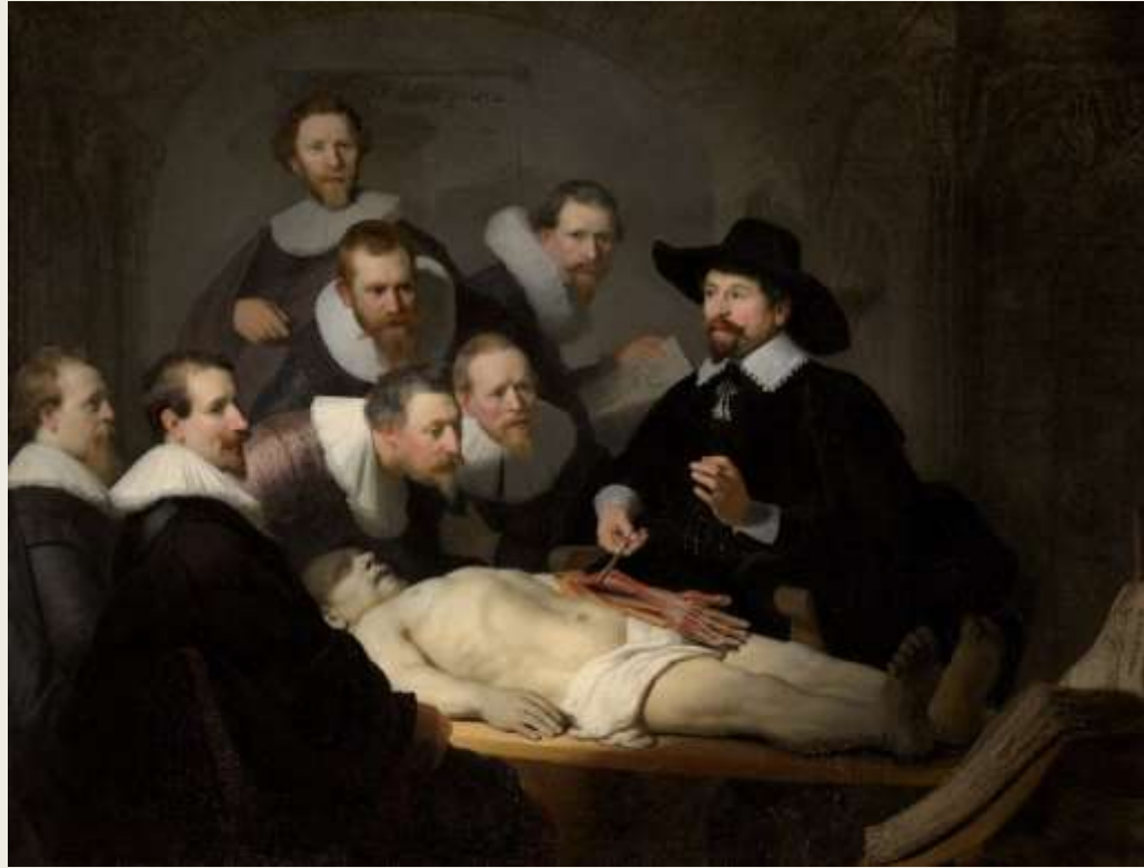
Rembrandt, La Leçon d'anatomie du docteur Tulp, 1632 Mauritshuis, La Haye